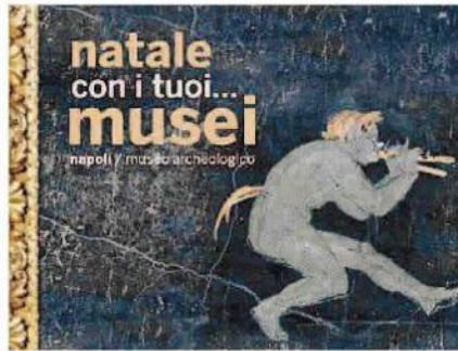
Il manifesto per il Museo Archeologico

UN INVITO a scoprire le bellezze della città. Un'idea di valorizzazione che non si ferma solo al patrimonio artistico, ma guarda anche a quella dei giovani talenti partenopei. È questa la mission di “Natale con i tuoi... musei”, progetto nato, in occasione delle festività alle porte, da un'idea dell'assessorato alla cultura del Comune in sinergia con la direzione regionale del ministero dei Beni culturali, Polomuseale, Soprintendenze e l'Accademia di Belle arti. E proprio ai ragazzi del corso di primo e secondo livello di graphic design per la comunicazione pubblica della stessa accademia è stata affidata la campagna pubblicitaria dell'iniziativa. Una vera e propria “mostra en plein air” fatta di manifesti luminosi, che saranno esposti lungo le strade della città da domani fino al 31 gennaio. Sono 40 e ritraggono le opere più famose e rappresentative di quattro musei coin-