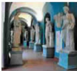
Belle arti Sala dell'Accademia