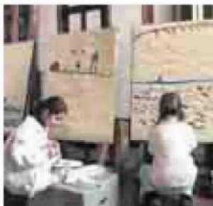
Laboratori Per i più piccini