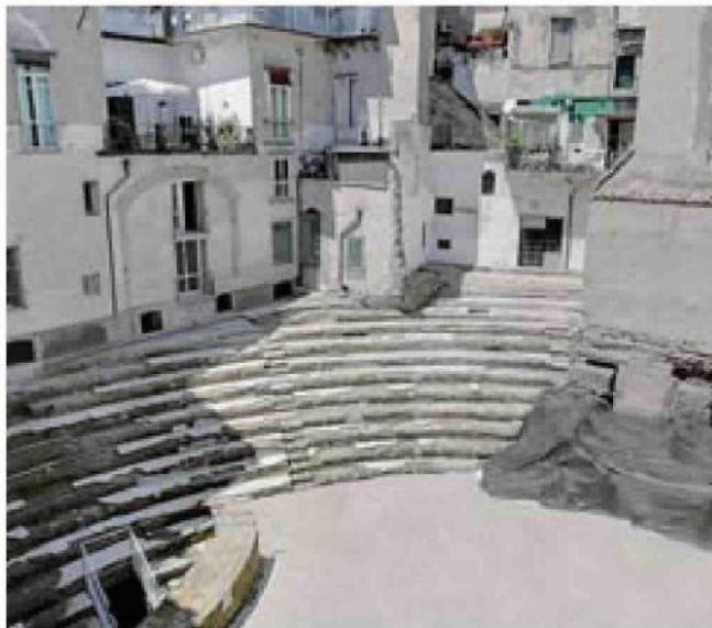
Teatro di Neapolis Dal 20 visite al cantiere degli scavi alla Anticaglia

Da segnalare, da domani, l'apertura straordinaria dell'Area archeologica di Carminiello ai Mannesi con visite guidate sino 22 aprile e invece dal 20 al 22 aprile quella