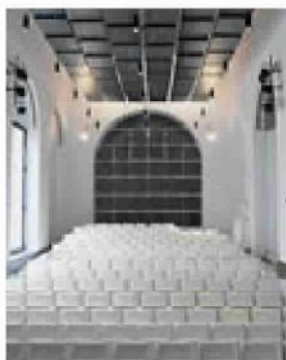
Il Teatro dell'Accademia di Belle Arti di Napoli

R itorna oggi, dalle 10 alle 14, «L'Accademia Svelata», l'iniziativa ideata dall'Accademia di Belle Arti di Napoli che ogni terza domenica del mese apre le sue porte alla città con un fitto programma di eventi per adulti e bambini. Il primo appuntamento dell'iniziativa che giunge alla sua quinta edizione, è dedicato a tutti i nuovi studenti Erasmus ai quali saranno offerte visite guidate gratuite in lingua all'intero patrimonio storico, artistico e bibliografico dell'Accademia. Questo il programma di oggi: dalle 11 alle 13 visite guidate agli spazi della Galleria dell'Accademia, Biblioteca «Anna Caputi», Teatro «Antonio Niccolini», ed all'Aula Magna; visita guidata alla mostra «Giornale dall'Italia» a cura del professore Gianfranco D'Alonzo. Nella Galleria del Giardino si volgerà il laboratorio didattico «Schizzi d'autunno» per bambini dai 6 ai 10 anni. Infine, dalle 12, concerto per pianoforte a cura del Conservatorio di Musica San Pietro a Majella; pianista Giovanni Albino. In programma musiche di Beethoven, Liszt, Rachmaninov.