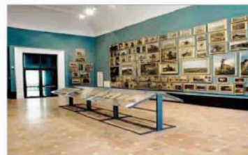
Una sala dell'Accademia

cimentarsi in un ritratto di gruppo di tutti i genitori presenti alle domeniche dell'Accademia svelata, in un laboratorio ispirato agli spunti tratti da David Hockney dalla fotografia.