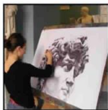
Accademia delle Belle Arti di Napoli